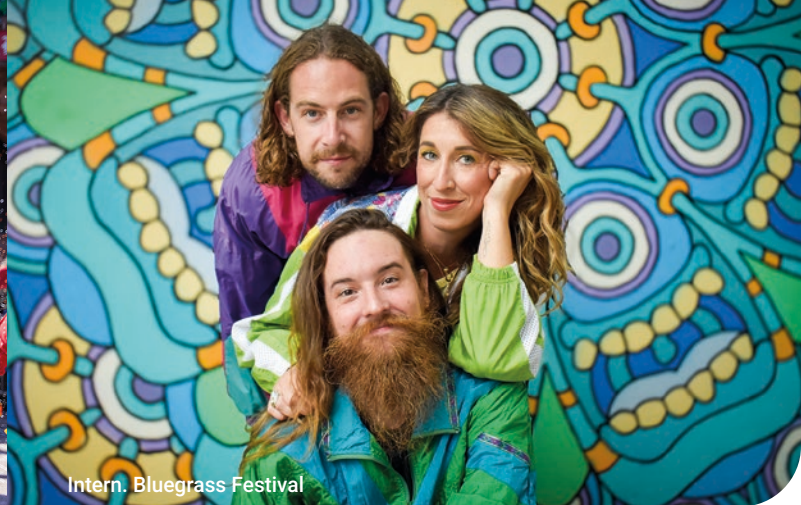
Intern. Bluegrass Festival