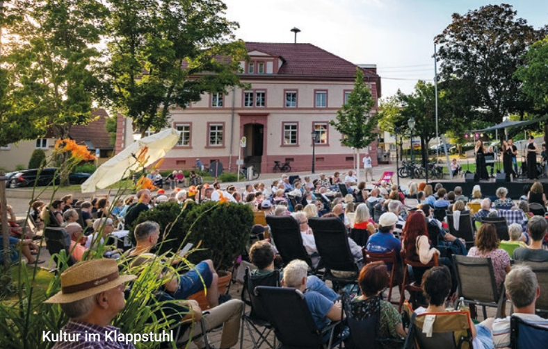
Kultur im Klappstuhl