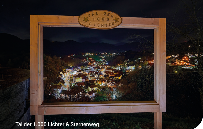
Tal der 1.000 Lichter & Sternenweg